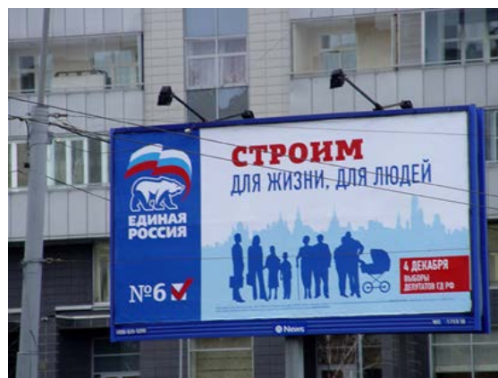
Агитация политической партии «Единая Россия» 22

Такие примеры хорошо демонстрируют, как бюджетные средства могут быть использованы для скрытой политической рекламы. Кроме того, десятки очень похожих друг на друга сайтов префектур и управ, которые публикуют практически одинаковый контент, может использоваться органами власти для искусственного выведения интересующих их новостей в топы новостных обзоров «Яндекса» и других поисковиков. Можно предположить, что благодаря такой технологии сайт подмосковного правитель-