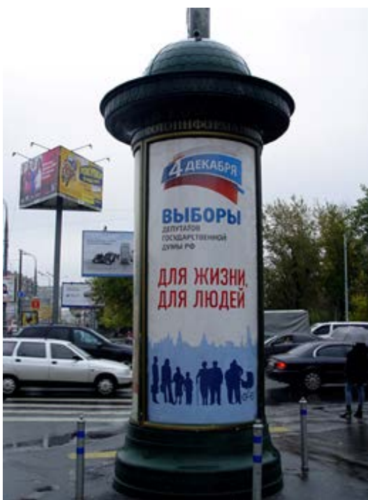
Материалы, оплаченные из бюджета

Перед выборами в Госдуму в 2011 г. в Москве появились оплаченные из бюджетных средств билборды, призывающие прийти на выборы. Дизайн этих билбордов был идентичен предвыборной агитации одной из партий до степени смешения.